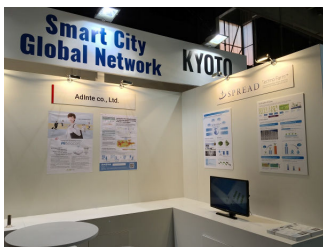
パビリオンの様子 (スプレッドは右側)

スプレッドの展示にご来場の方々に深く御礼申し上げます。スプレッドは、国内だけでなく海外における持続可能な農業の実現に向けて、他分野との連携と協力を重ね、今後もさらなる技術革新に挑戦し続けてまいります。