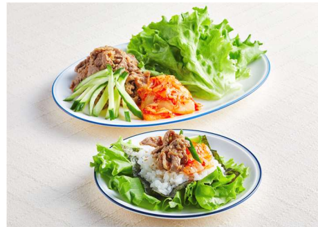
焼肉のつけブリーツレタス包み