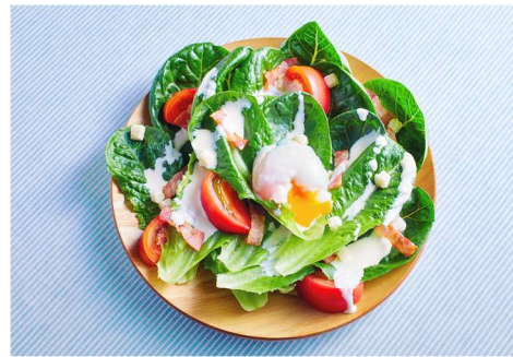
ロメインレタスのシーザーサラダ