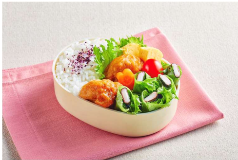
かにかまのフリルレタス巻き