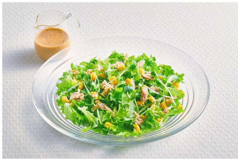
フリンジレタスとツナコーンのごまドレサラダ